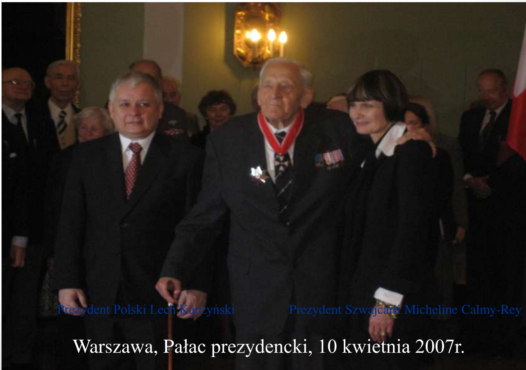
Prezydent Polski Lech Kaczyński