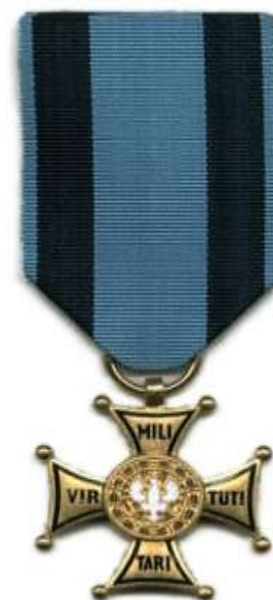
Virtuti Militari V Klasy