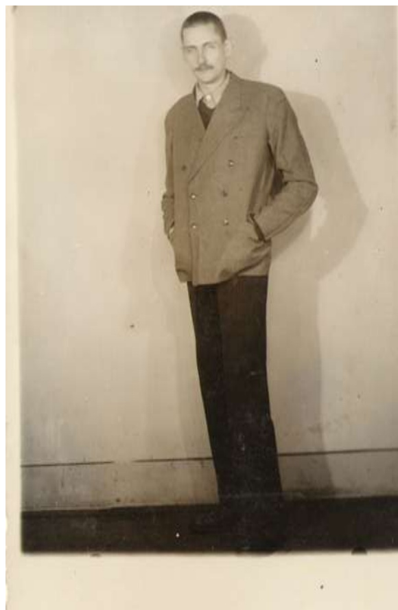
Po uwolnieniu z więzienia gestapo, Lwów 1942