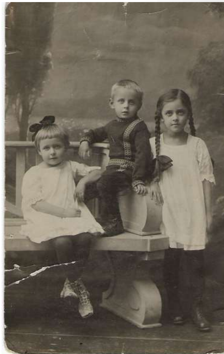
Z siostrami, rok 1919